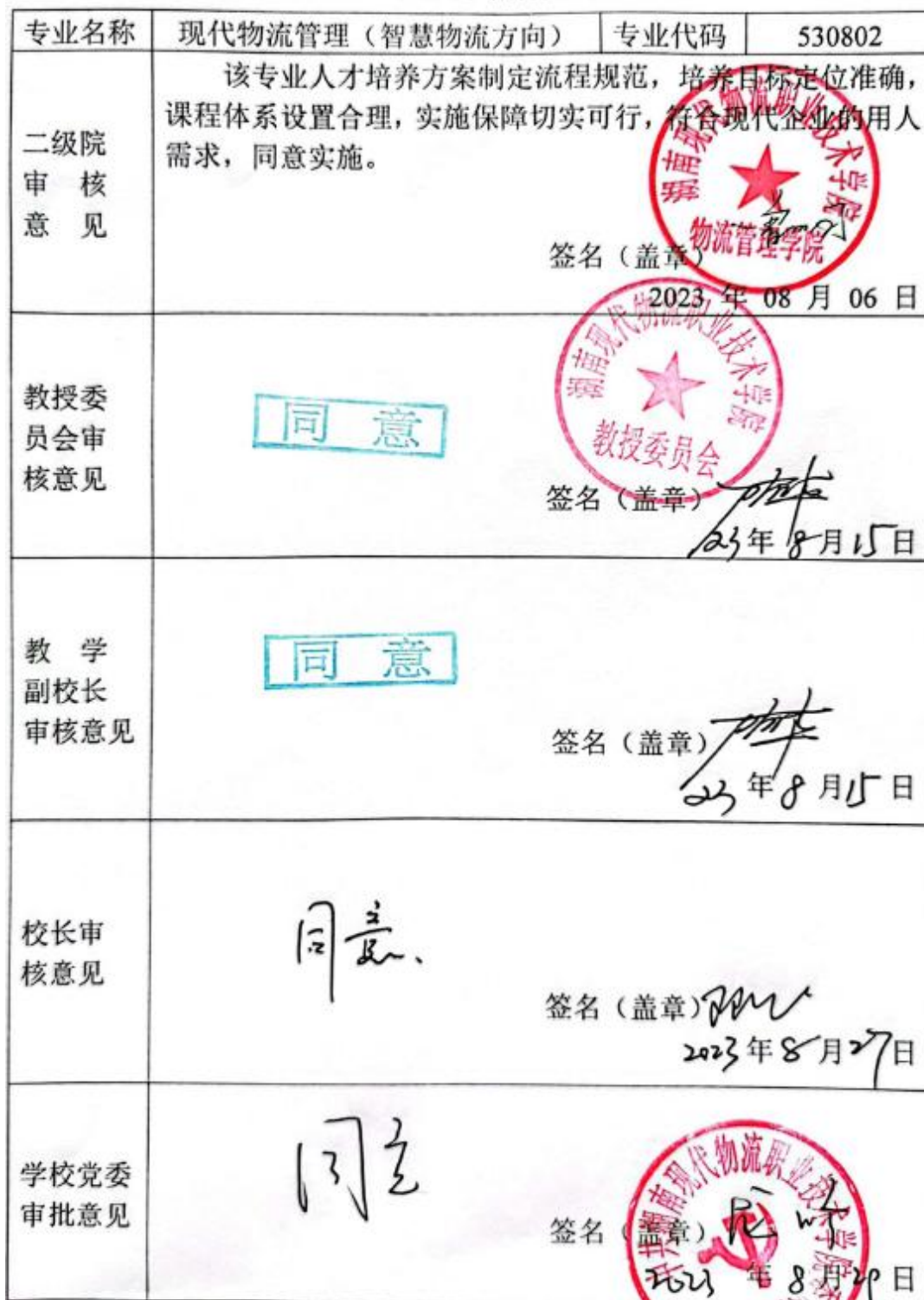
附表 7 专业人才培养方案审批表